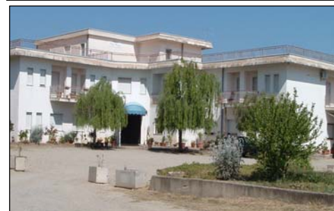
Istituto Sacro Cuore di Corigliano nella zona di S. Lucia