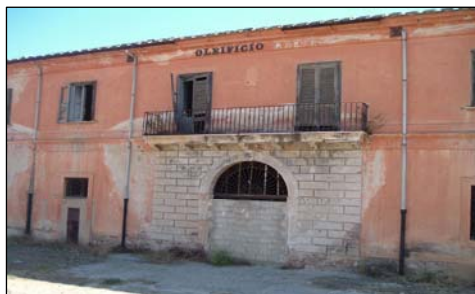
TUTTO PASSA